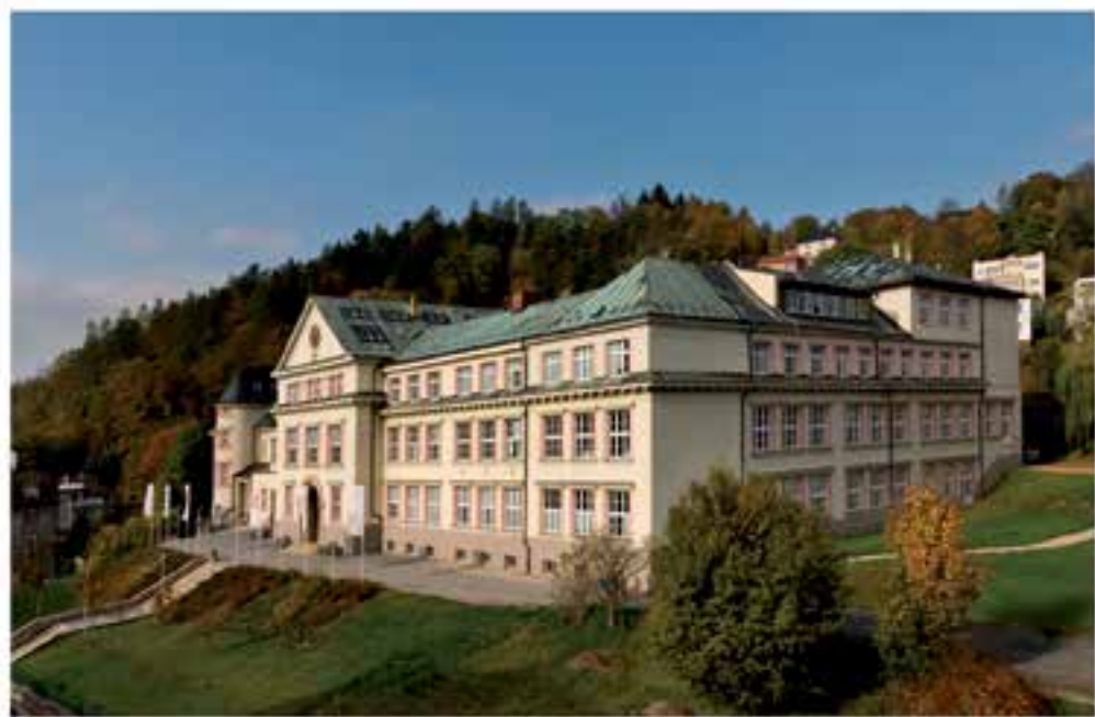
Budova Střední uměleckoprůmyslové školy sklářské v roce 2019, foto: O. Kocourek.