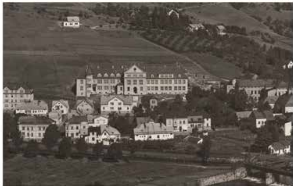
Archivní fotografie novostavby sklářské školy v roce 1925.