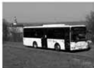
Turistické linky opět v provozu.

Turistické linky opět v provozu Koronavirus zasáhl i do veřejné dopravy, která vlivem nastavených opatření oznamujících volný pohyb obyvatel pocítila výrazný úbytek cestujících. Zdálo se, že budou obraceňeny i spoje, které slouží pro uspokojování volnočasových aktivit. „Turistické“ linky však z velké části přešly z a opožděným začátkem budou od června nebo o příštířnách v Libereckém kraji opět nabízet své služby. V autobusech i vlacích dopravci zajišťují dezinfikování prostor a po cestujících se žádá vzájemná ohleduplnost zejména v ochraně dýchacích cest a pokud možno dodržování bezpečné vzdálenosti. Kozach nabídky turistických spojů doporučujeme ověřovat